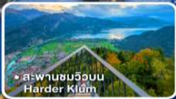
• สะพานชมวิวยิบ Harder Klümm