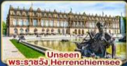
Unseen พระราชวัง Herrenchiemsee

บรรยากาศแสนโรแมนติก เส้นทางแห่งความฝัน พีชิต 2 ยอดเขา 2 ประเทศ TITLIS • ZUGSPITZE