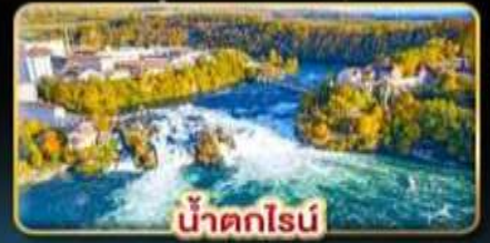
น้ำตกไรน์