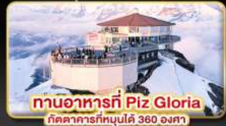
ทานอาหารที่ Piz Gloria ภัตตาคารที่หมุนได้ 360 องศา