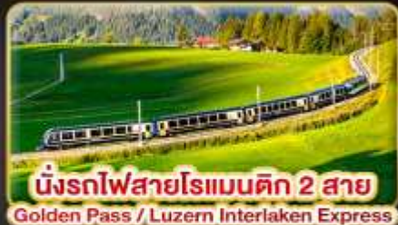
นั่งรถไฟสายโรแมนติก 2 สาย Golden Pass / Luzern Interlaken Express

📅 เดินทาง: 5-12 เม.ย. | 31 พ.ค.-7 มิ.ย. 69