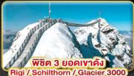
พิชิต 3 ยอดเขาตั้ง Rigi / Schilthorn / Glacier 3000