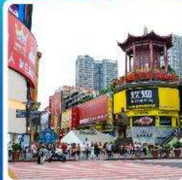
ถนนหลงซิงลู่

● ไอโกล์ เกี่ยวสองเมือง ฉางซา ฉางเจียเจีย เช็กอินประตูสวรรค์ อุทยานเทียนเหมินซาน