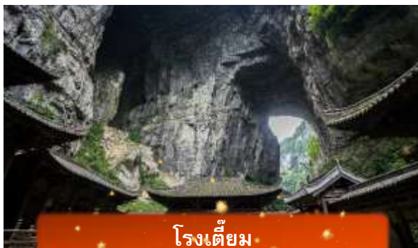
โรงเตี๊ยม

นำท่านลง ลิฟต์แก้ว สู่หุบเหวลึก 80 เมตร ชมกลุ่มสะพานสวรรค์ – สะพานหินธรรมชาติใหญ่ที่สุดในเอเชีย 3 แห่ง ได้แก่ สะพานมังกรสวรรค์ มังกรเฉียว และมังกรดำ ท่ามกลางธรรมชาติสุดอลังการ พร้อมแวะโรงเตี๊ยมโบราณฉากจริงจากภาพยนตร์ “ศึกโค่นบัลลังก์วังทอง” รวมค่าลิฟท์ 1 เที่ยว