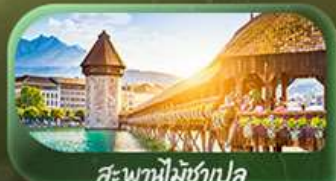
สะพานไมซ์าเปิล