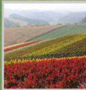
"SHIKISAI NO OKA"