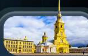
ป้อมปีเตอร์แอนด์ปอล