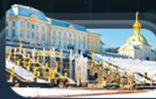
พระราชวังปีเตอร์ฮอฟ