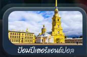
ป้อมปีเตอร์แอนด์ปอล

highlight สองเมืองไฮไลท์ของรัสเซียที่ไม่ควรพลาด! ตื่นตาตื่นใจกับมหาวิหารเซนต์บาซิล ชมความยิ่งใหญ่ของจัตุรัสแดง สัมผัสอดีตที่พระราชวังเครมลิน ชมความงามของสถานีรถไฟใต้ดินมอสโก ชาร์กอร์ส โบสถ์ไอสิกรีนดี เป็นเขาสเปร์โรวให้คุณได้สัมผัส ชมความงามพระราชวังฤดูหนาว พิพิธภัณฑ์ฮอร์มีทาจ ป้อมปีเตอร์แอนด์ปอล และมหาวิหารเซนต์ไอแซค