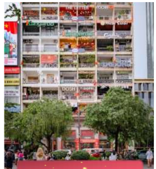
The Cafe Apartment.

ที่พัก Sai Gon Emerald ระดับ 4 ดาวห้องถิ่นหรือเทียบเท่า