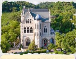
ทะเลสาบสุริยขึ้นจันทรา