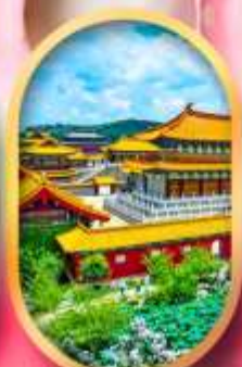
เมืองจำลองสามก๊ก