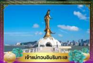
เจ้าแม่ทวนอิมริมทะเล