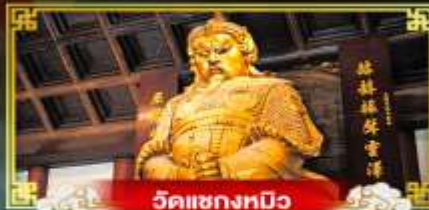
วัดเข่งทมิฬ