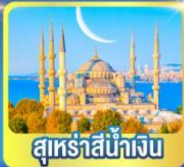
สุหรัสน้ำเงิน