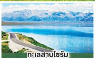
ทะเลสาบไซรัม