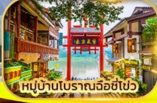
หมู่บ้านโบราณฉือชี่ไป๋