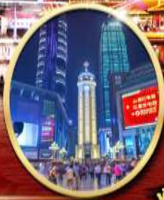
ถนนคนเดินเจี่ยฟางเป่ย์

ไอโคนที่พิเศษ! สุกหม่าล่า 1 มื้อ พักโรงแรม 4 ดาว 4 คืน ไอโคนที่สุดจ้าว! บิลล์ฟักแก้วชมความอลังการ กลางหุบเขา