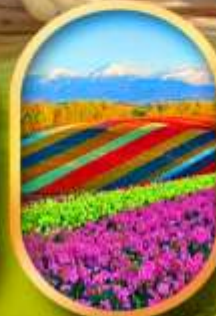
สวนดอกไม้ซึทชิโซ