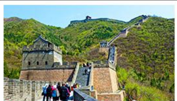
กำแพงเมืองจีนด่านจวิยงกวน