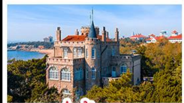
ป่าตึกวน

พระราชวังฤดูร้อน - วิวเมืองซิงเต่า รถไฟความเร็วสูง - ภูเขาเหลาซาน กำแพงเมืองจีนด่านจวิยงกวน - ป่าตึกวน พักโรงแรมระดับ 4 ดาว - ไม่หลงร้านช้อปปิ้ง มือพิเศษ เปิดปักกิ่ง, หม้อไฟซีฟู้ด