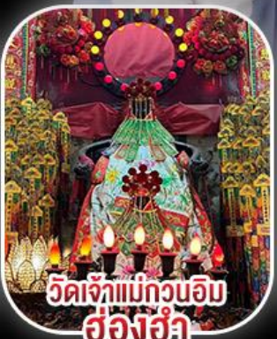
วัดเจ้าแม่กวนอิม ฮ่องฮำ