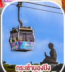
กระเช้าแองปัง พระใหญ่ไผ่หลิน