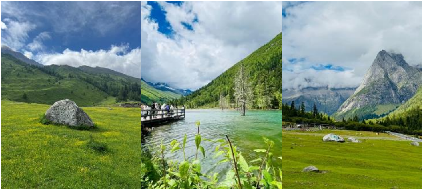
จากนั้นนำท่านเดินทางเข้าสู่พักที่ เมืองตุเจียงเยียน (ใช้เวลาเดินทางประมาณ 3 ชั่วโมง)