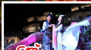
ซีวี่จิ้งจอกขาว