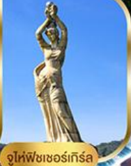
จูไห่ฟิชชอร์ทิวรา