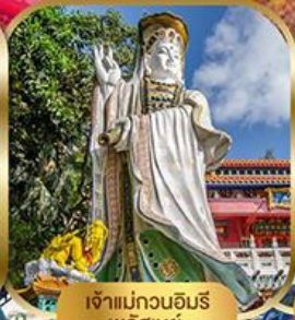
เจ้าแม่กวนอิม พลัสเบย์