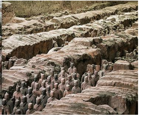
สุสานกองทัพทหารม้าจีนซี