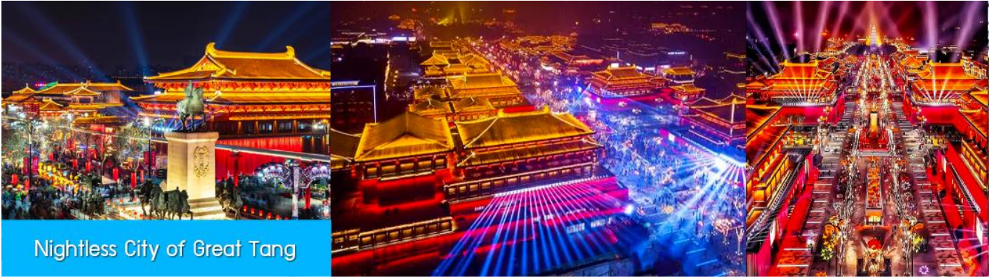
Nightless City of Great Tang

หลังอาหารนำท่านเที่ยวชม Nightless City of Great Tang สถานที่ท่องเที่ยวกลางแจ้งที่สร้างจำลองบรรยากาศย้อนยุคสมัยราชวงศ์ถังที่สุดอลังการ ท่ามกลางแสง สี และ โคมไฟที่ประดับอย่างสวยงามตระการตา เป็นที่เชื่อกัน ถ่ายภาพยอดเยี่ยมแห่งใหม่ของนครซีอาน พักที่ HOLIDAY INN EXPRESS HOTEL โรงแรมระดับ 4 ดาวท้องถิ่นในนครซีอาน