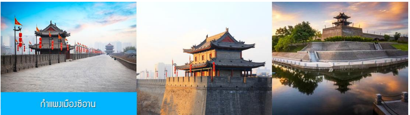
กำแพงเมืองซีอาน

หลังอาหารนำท่านนั่งรถบัสผ่านชม กำแพงเมืองโบราณ 西安古城墙 (เป็นการนั่งรถผ่านชมด้านนอก เนื่องจากค่าทัวร์ไม่ได้รวมค่าบัตรเข้าชมด้านใน ) กำแพงเมืองเก่าแก่ที่สร้างขึ้นในสมัยราชวงศ์หมิง อายุกว่า 600 ปี ตัวกำแพงมีฐานกว้าง 18 เมตร มีความสูง 12 เมตร ความยาวโดยรอบ 11.9 กิโลเมตร เป็นกำแพงเก่าแก่ที่ยังคงสภาพสมบูรณ์ที่สุดของจีน และเป็นโบราณสถานขึ้นชื่อของเมืองซีอาน