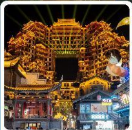
ตึกหอคจรรย 72