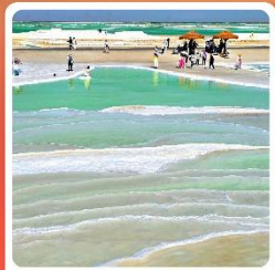
ทะเลสาบเกลือจาเอ้อหนาน

ไฮไลท์! กำมั่วเกาตู กำพุทศศิลป์โบราณ มรดกโลก UNESCO ภูเขาสายรุ้งจางเย่ ภูเขาหินสีสันแปลกตา หนึ่งในภูมิประเทศที่แปลกที่สุดในโลก