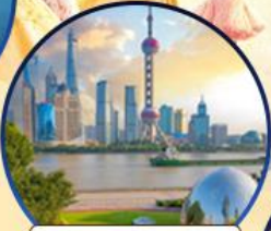
นอร์ทปิ่น กรีนแลนด์