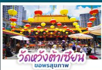
วัดแห่งต้าเซียงน บอพรลุขภาพ