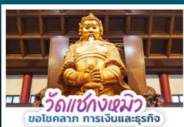
วัดแซงกงเฉมว๋ ขอโชคลาก การเงินและธุรกิจ