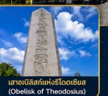
เสาอเบลิสก์แห่งโรดเดเซียส (Obelisk of Theodosius)