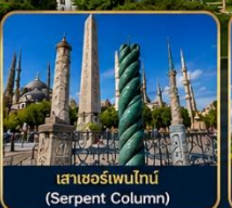
เสาฮอร์เพนไทน์ (Serpent Column)