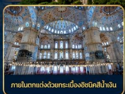
ภายในตกแต่งด้วยกระเบื้องอิสตันบูลสีน้ำเงิน