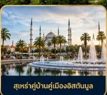
สุเหร่าบ้านคูเมืองอิสตันบูล