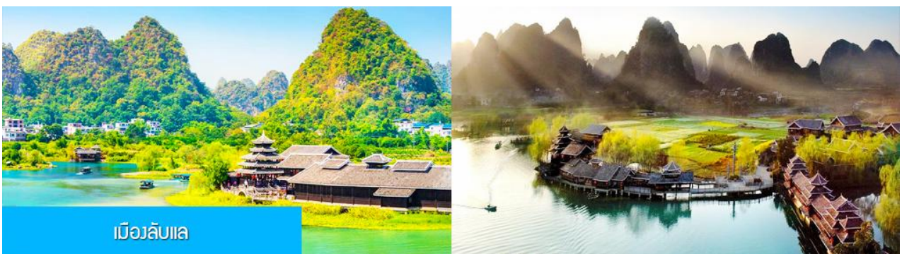
เมืองลับแล

เย็น อิสระอาหารค่ำเพื่อความสะดวกในการเดินเที่ยว และชมอาหารพื้นเมืองตามอัธยาศัย พักที่ YANGSHUO ELITE GARDEN HOTEL ระดับ 4 ดาว ท้องถิ่นหรือเทียบเท่าใน เมืองหยางชว่