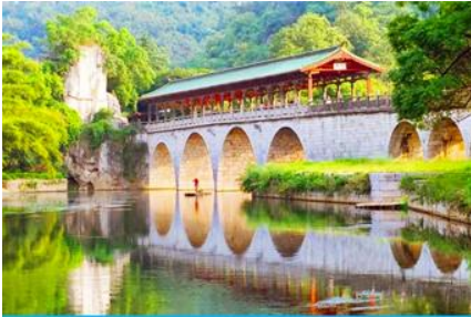
สวนเจ็ดดาว

หลังอาหารเช้าท่านเดินทางสู่ เมืองกุ้ยหลิน 桂林 เมืองท่องเที่ยวชื่อดังในมณฑลกวางสี