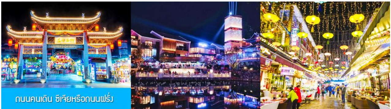
ถนนคนเดิน ซิเจียหรือถนนฝรั่ง