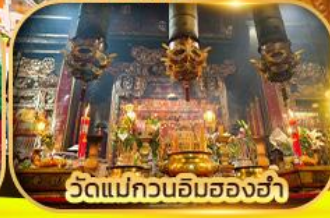
วัดแม่กวนอิมของฮ่า