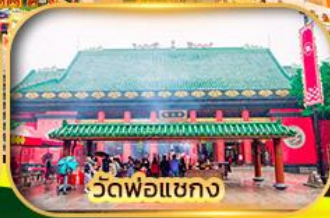
วัดพ่อแซกง