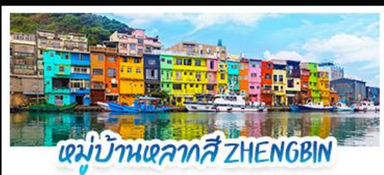
หมู่บ้านหลากสี ZHENG BIN

18 - 21 ก.ค. 69 | 12 - 15 ก.ย. 69 15 - 18 ส.ค. 69 | 28 - 31 ต.ค. 69