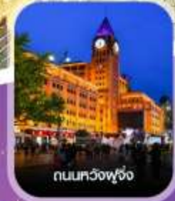
ถนนทวิงฟู่จิ่ง