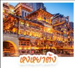
ตึกเฉาตง

สัมผัสใบไม้แดงสุดงดงามที่ ภูเขาหมื่นชางชาน และ ภูเขากวงอู่ชาน ชมวิวกลางคืนสุดอลังการที่ หงหยาดัง แลนด์มาร์กชื่อดังแห่งฉางชิ่ง สักการะพระโพธิสัตว์เจ้าแม่กวนอิม ณ วัดหลิงฉวน ขอพรเสริมสิริมงคล ช้อปปิ้งแลนด์มาร์กสุดฮิต เพนต้าปิ่นตึก IFS + POP MART ช้อปปิ้งจุใจที่ ไถ่กู่หลี่ ถนนคนเดินชุมชน