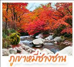
ภูเขาหมื่นชางชาน