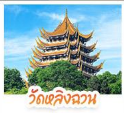
วัดเลิ่งฉวน