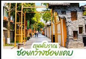
ถนนโบราณ ชอยกว้างชอยแคบ