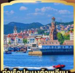
ท่าเรือประมงต้าเหลียน