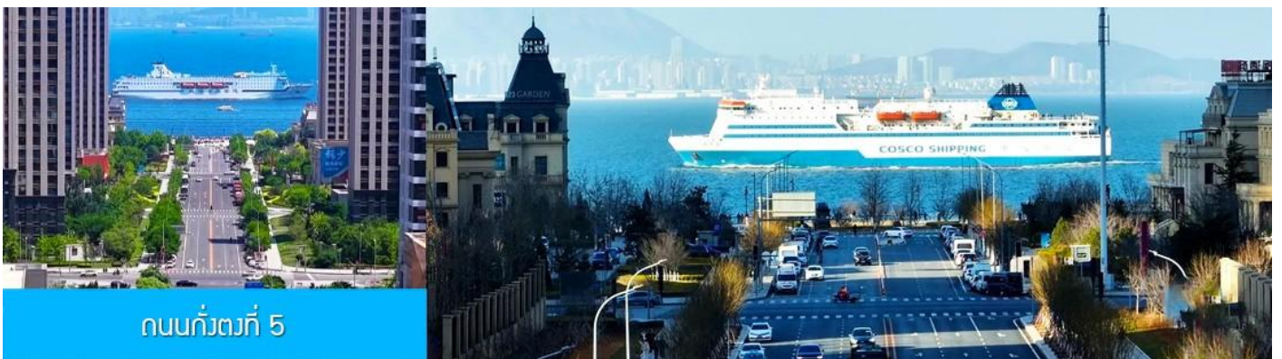
ถนนกว้างที่ 5

จากนั้นนำท่านเที่ยวชม สวนน้ำเมืองเวนิสตะวันออก 大连东方威尼斯城 เป็นเมืองเวนิสจำลองที่ถูกสร้างขึ้นด้วยทุนกว่า 8,000 ล้านดอลลาร์ ออกแบบโดยบริษัท ARC จากประเทศฝรั่งเศส โดยจำลองผังเมืองเวนิสในประเทศอิตาลี บนพื้นที่กว่า 400,000 ตารางเมตร ประกอบด้วยคลองเวนิสและอาคารที่มีสถาปัตยกรรมแบบตะวันตกกว่า 200 หลัง มีบริการล่องเรือคอนโดล่าแก่นักท่องเที่ยว นำท่านเดินชม ถ่ายภาพที่ระลึกท่ามกลาง