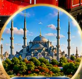
สุเหร่าสีน้ำเงิน Blue Mosque