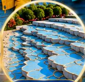
ปามุกคาล์ Pamukkale