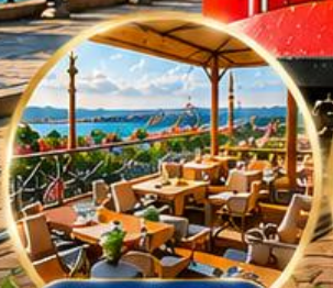
Seven Hills Cafe ชมวิว อิสตันบูล