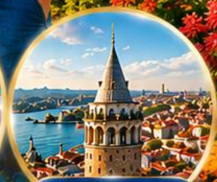
หอคอยกาลาตา Galata Tower