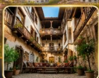
บ้านเรือนสไตล์ออตโตมัน อายุกว่า 200 ปี

เมืองท่องเที่ยวที่มีชื่อเสียงของจังหวัดการาบิก (Karabük) ในปี 1994 เมืองซาฟรานโบลู ได้ถูกองค์การยูเนสโกยกให้เป็นมรดกโลกทางด้านวัฒนธรรม