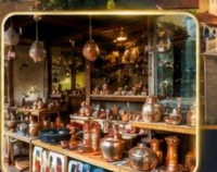
เลือกซื้อของฝากงานหัตถกรรมพื้นเมือง

สัมผัสเสน่ห์แห่งอดีตในเมืองที่เวลาเดินช้าลง กับสถาปัตยกรรมอันงดงาม วัฒนธรรมที่ยังคงมีชีวิต และความอบอุ่นจากผู้คน