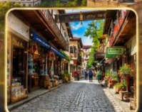
เดินเล่นย่านเมืองเก่าบรรยากาศย้อนยุค