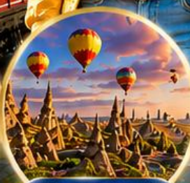
เมืองคปปาโดเกีย Cappadocia