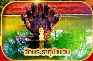
วัดพระธาตุบึงพวน