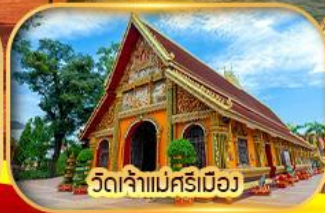
วัดจำแม่ศรีเมือง