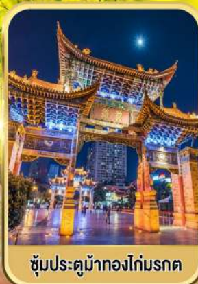
ซุ้มประตูม้าทองไถ่มรดก