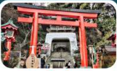
ศาลเจ้าอะชิมะ