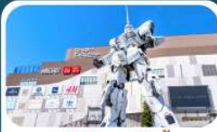
ห้างโตเวอร์ซิตี