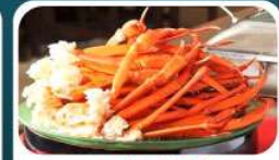
ชาบูบุฟเฟ่ต์