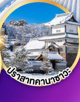
ปราสาทคานาซาวะ