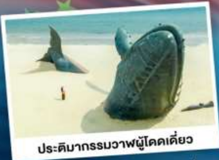
ประติมากรรมวาฬโคดเคียว

เที่ยวเมืองชายทะเลโอปิตีตี ซิงเต่า - ต้าเหลียน - ฉะเจียงไถ่