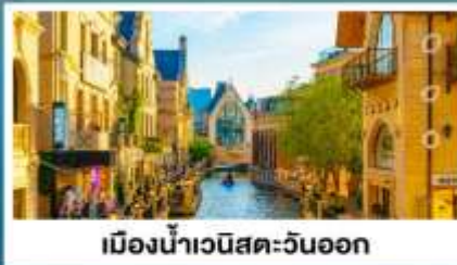
เมืองน้ำเวนิสตะวันออก