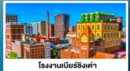
โรงงานเบียร์ซิงเต่า