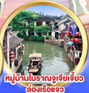
หมู่บ้านโบราณจูเจียเจี้ยว ล่องเรือแจว