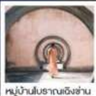
หมู่บ้านโบราณเชิงชาน